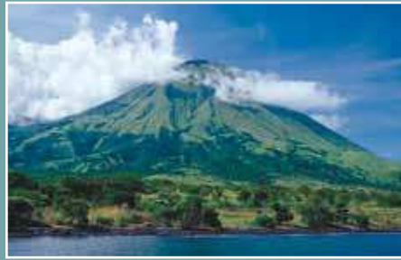
Tauchen Sie direkt an einem aktiven Vulkan