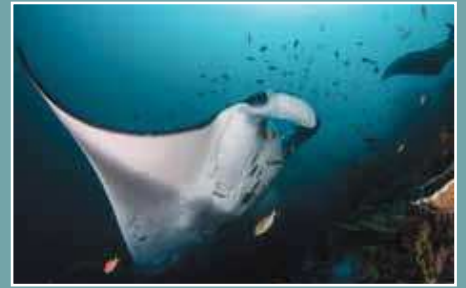
Schwimmen und Tauchen Sie mit Manta Rochen