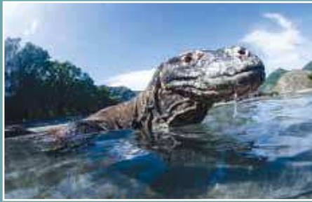
Besuchen Sie die scheuen Komodo-Warane